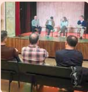
Intervenció de LA UNIÓ en la xarrada sobre els efectes dels acords comercials amb tercers països a Betxí.