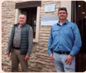
Centre Naturem a Borriana.