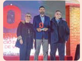
LA UNIÓ, en l'acte de lliurament dels Premis de El Periódico de Aquí de l'Horta Nord.