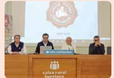
Participació de LA UNIÓ a una xarrada sobre Mercosur a Borriana.