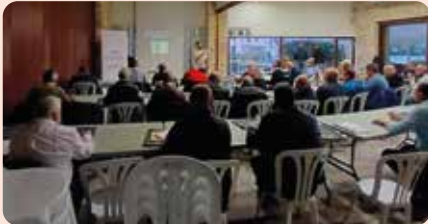
Curs de Manipulador de Plaguicides de LA UNIÓ a Gandia.