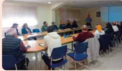
Curs de Manipulador de Plaguicides de LA UNIÓ a Elx.