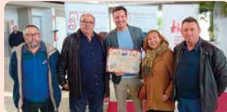
Una delegació de LA UNIÓ, en la feria del embutido de Requena.