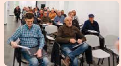
Curso de Manipulador de Plaguicidas de LA UNIÓ en Ayora.