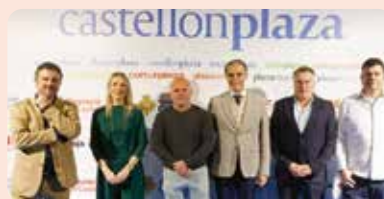
Presentació de l'Anuari de Castellón Plaza.