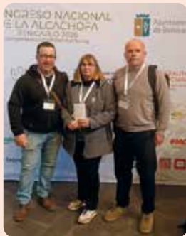
Una representació de LA UNIÓ al Congrés Nacional de la Alcachofa celebrat a Benicarló.