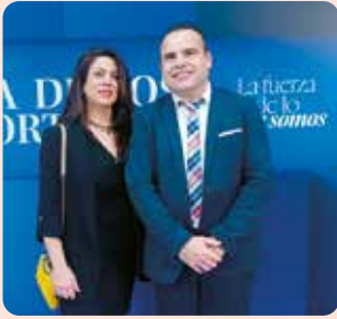
Presència de LA UNIÓ en la Gala Importants del Diario Información.