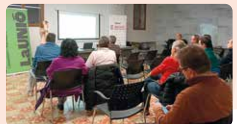
Xarrada informativa de LA UNIÓ a Nules per explicar com protegir la collita davant riscos comercials, climàtics i financers, amb ferramentes clau com el contracte de venda, l'assegurança agrària i l'assegurança de crèdit.