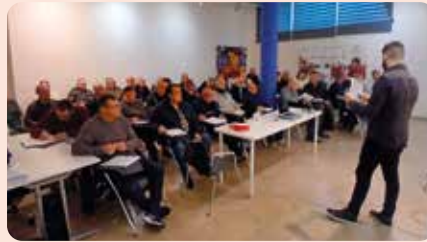
Curs de Manipulador de Plaguicides de LA UNIÓ a Xàtiva.