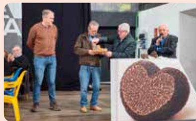
LA UNIÓ, un any més participant en la XXII Mostra de la Trufa Negra de l'Alt Maestrat, celebrada enguany a Catí.