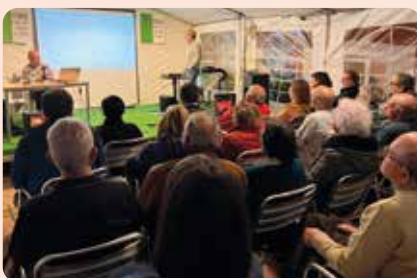
Xarrada informativa de LA UNIÓ sobre l'acord amb Mercosur a Bétera.