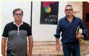
Acto de inicio de la Vendimia de la DO Alicante en Villena.