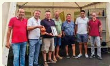
Estand de LA UNIÓ a la Fira de Nules.