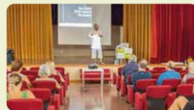
Xarrada informativa sobre sobirania alimentària i agricultura de proximitat a Quatretonda.