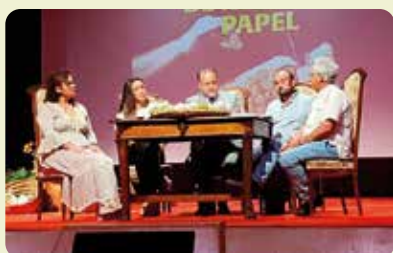
LA UNIÓ participa en l'acte del I tall del Raïm de Taula Embossat del Vinalopó a Novelda.