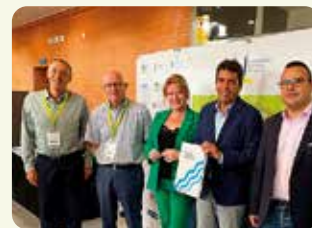
Una representación de LA UNIÓ en el Congreso Nacional del Agua celebrado en Albatera.