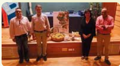
LA UNIÓ, a l'acte de presentació del Pla Dinamització del Moscatell a Benissa.