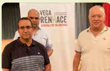
LA UNIÓ en el acto del Plan Vega Renhace en Daya Nueva.