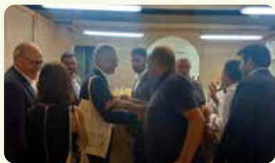
Acto de inauguración de la feria Ferevin en Requena.