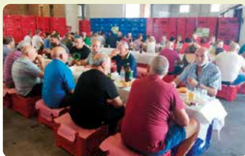
LA UNIÓ de Llauradors va celebrar el passat 31 de juliol la IX Trobada d'Autoconsum de la Vall d'Albaida a la localitat d'Otos. Va a ver un esmorzar popular i xarrades entre tots els assistent sobre tot el que hi ha de bo i de dolent al nostre camp valencià.