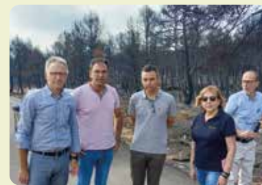
Visita de la Unió con autoridades al incendio de Venta del Moro.