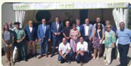
Estand de LA UNIÓ a la Fira de Morella.