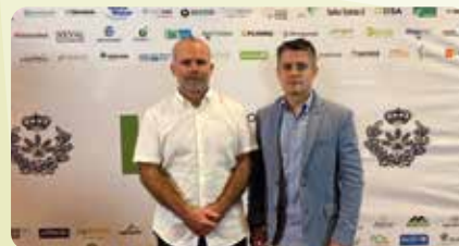
Assistència als Premis del COIAL.