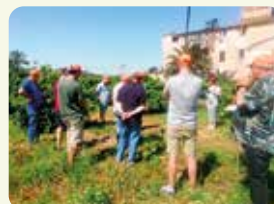
Visita tècnica a la EEA de Carcaixent per a veure la gestió dels assajos de cobertes vegetals al cultiu de cítrics i el banc de llavors.