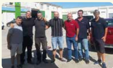
Visita tècnica empeltà cítrics a la Poble Llarga.