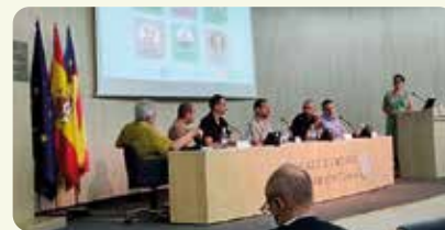
LA UNIÓ va participar en la jornada organitzada per Innotransfer sobre les tecnologies avançades en l'agricultura de precisió.