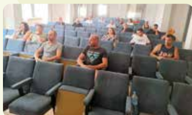
Curs de benestar animal sector porcí a Vall d'Alba.