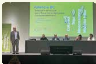
Simposi Internacional sobre Biocontrol en Agricultura a València.