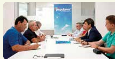
Reunió de treball de LA UNIÓ amb el Partit Popular de la Comunitat Valenciana per a traslladar les nostres propostes.