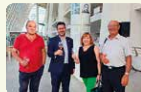
Una representació de LA UNIÓ en la XVI Noche del Vino de la DO Valencia.