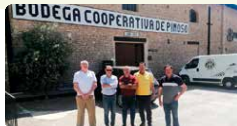
Visita de LA UNIÓ a la Bodega Cooperativa de Pinoso.