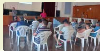
Curso bienestar animal sector porcino en Fuentes de Júcar.