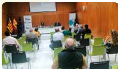
Xarrada informativa de LA UNIÓ a la seu de la UA a Calp sobre tècniques de negociació.