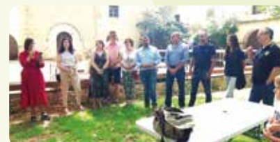
Fira de Sant Pere i Sant Pau a Albocàsser.