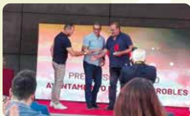
LA UNIÓ entregó el Premio Solidaridad de El Periódico de Aquí CV Interior al Ayuntamiento de Fuenterrobles por su labor humanitaria en la frontera de Ucrania.