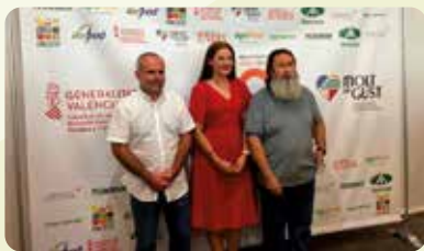
LA UNIÓ en el acto del 60 aniversario de Valencia Fruits.