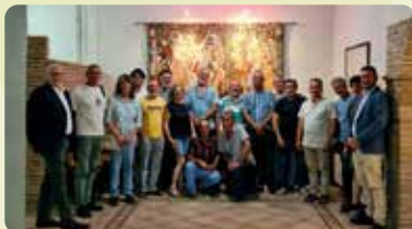
Representants de LA UNIÓ van participar en l'assemblea general de la Asociación para la defensa de la producción y alimentación ecológica de la Comunitat Valenciana (ASECOCV).