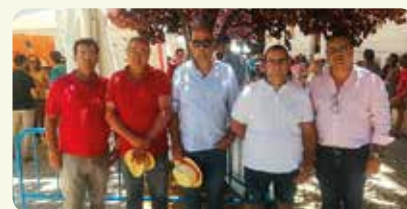
LA UNIÓ, en les festes de les Fogueres a Alacant.