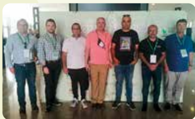
II Jornadas Presente y Futuro de la Agricultura en la Vega Baja del Segura.