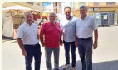
LA UNIÓ va estar present a la Fira de l'Oli de Canet de Roig (Maestrat).