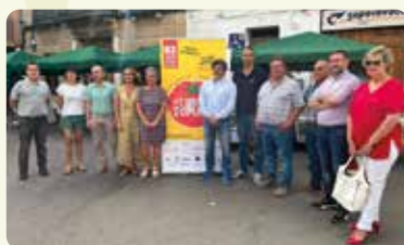
La Fira de la Tomata a Meliana.