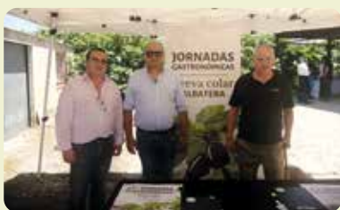
Una representació de LA UNIÓ en el tradicional primer corte de la Brevia Colar de Albatera.