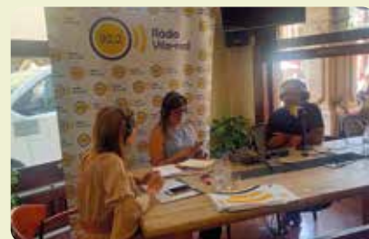
LA UNIÓ a les bodeguetes dels mitjans de comunicació de les festes de Sant Pasqual de Vila-real.