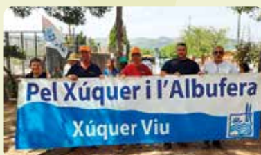
Concentració en defensa del Xúquer a Antella.