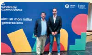
Dia Mundial del Cooperativisme a Castelló.