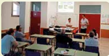
Jornada sobre infraestructures ecològiques per a millorar el control de les plagues celebrada a l'Estació Experimental Agrària de Carcaixent.