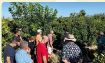
Curs poda de cítrics a Albalat de la Ribera.