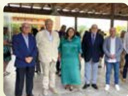
LA UNIÓ, en la IX Trobada de l'Enginyeria Agrícola i la jornada sobre innovació i ajudes del COITAVC.