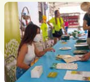
LA UNIÓ, en la XV Feria de Agricultura y Ganadería celebrada en Barracas (Alto Palancia).