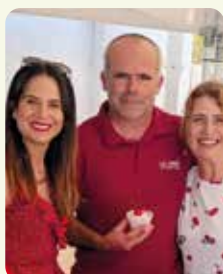
Feria de la cereza en Villamalur.