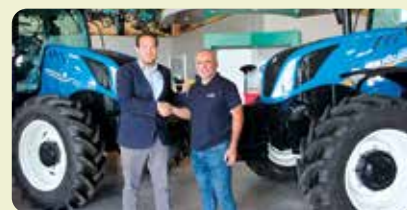
Acte renovació del conveni amb New Holland a l'Alcúdia.