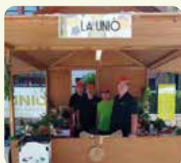
LA UNIÓ, a la Fira de Sant Pasqual del Genovès (la Costera).