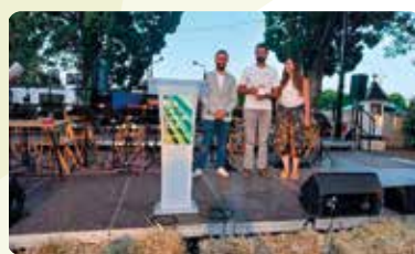
Celebració Dia de l'Horta a Carpesa.