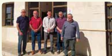
Reunió amb Ajuntament de la Jana (Maestrat) sobre desplaçament.