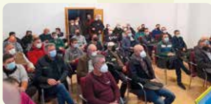
Xarrada informativa sobre l'ús de drons en l'arròs a Sueca.