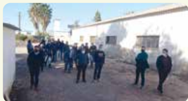
Visita varietal de cítrics per la Plana Baixa.