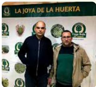
X Aniversario Alcachofa Vega Baja del Segura.