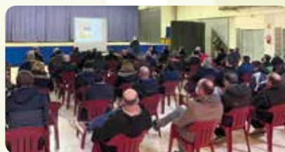
Xarrada informativa sobre la nova PAC a la Jana.