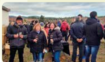
XXIII Jornada Vitivinícola de la DO Vinos Utiel-Requena.