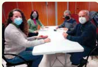
Reunió de treball amb les diputades Marisa Saavedra i Beatriu Gascó d'Unides Podem.