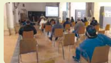
Charla informativa sobre la nueva PAC en Jérica.