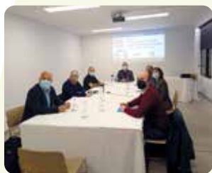
Debat sobre consum responsable al diari Mediterráneo.