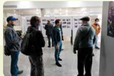
Congrés de la Marjaleria a Castelló.