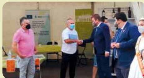
Fira Agrícola de Nules.