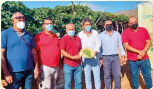
I Corte Uva Embolsada del Vinalopó.