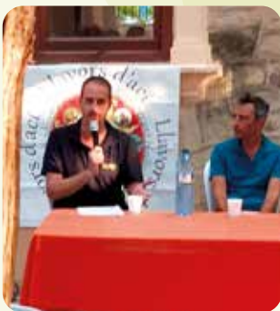
Participació en Fira de la Biodiversitat Cultivada de Carrícola.