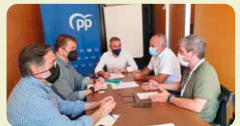
Reunió Grup Popular Corts Valencianes.