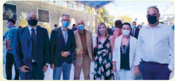
Conferència Teresa Ribera a Alacant.