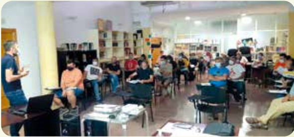
Curs d'olivicultura ecològica a Beniatjar.