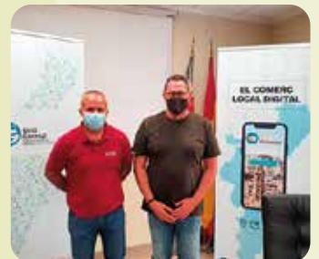
Reunió de treball amb Unió Gremial.