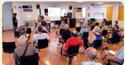
Xarrada Cotonet de Sud-àfrica a Oliva.