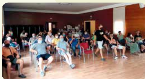
Xarrada Cotonet de Sud-àfrica a Montesa.