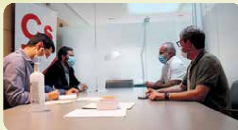
Reunió Ciudadanos Corts Valencianes.