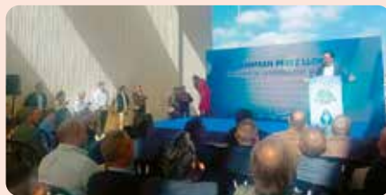
Representants de LA UNIÓ en el acto en defensa del trasvase Tajo-Segura celebrado en Alicante.