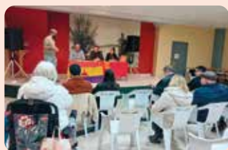
LA UNIÓ participó en una charla informativa sobre Mercosur organitzada por el PCPV en Utiel.