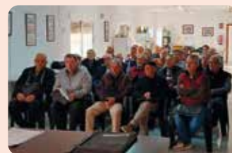
Curs de renovació de manipulador de plaguicides a Montaverner (Vall d'Albaida).