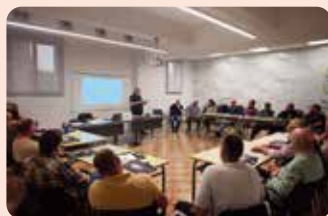
Curs de manipulador de plaguicides a Nules (Plana Baixa).