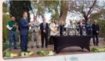
Representants de LA UNIÓ van participar un any més en la fira de l'encisam d'Alberic (Ribera Alta).