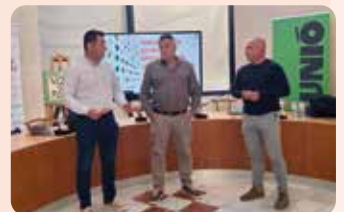
Xarrada de formació i maneig de collites, qualitat i engreix de cítrics a Les Alqueries (Plana Baixa).