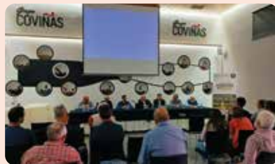
Una representació de LA UNIÓ estuvo presente en la candidatura de los productores a las elecciones de la DO Cava celebrada en Coviñas.