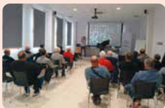
Curs de manipulador de plaguicides a Benigànim (Vall d'Albaida).