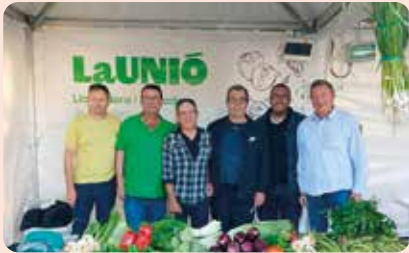
LA UNIÓ a FirAll, fira de l'all tendre a Xàtiva (La Costera). Va patrocinar el concurs de nugar alls tendres.