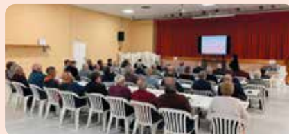
Curs de renovació de manipulador de plaguicides a Alcalá de Xivert (Baix Maestrat).