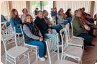
Jornades Vitivinícoles de la DO Utiel-Requena.