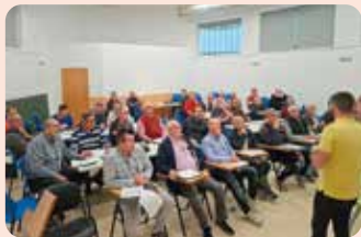
Curs de renovació de manipulador de plaguicides a Oliva (La Safor).