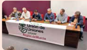
LA UNIÓ, en el acto de la nueva organización Unión de Uniones de la Región de Murcia celebrado en Jumilla.