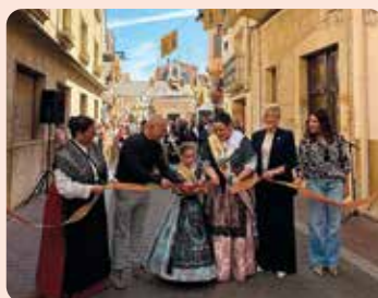
LA UNIÓ, present a la Fira de Càlig (Baix Maestrat).