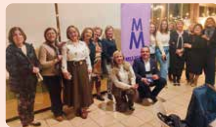
LA UNIÓ participó en una charla informativa sobre Mercosur en Elx organitzada per la Asociación de Mujeres de esta localidad.