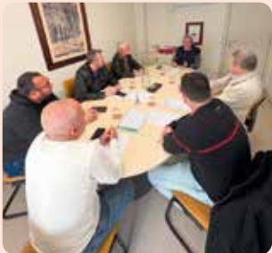
Reunió de LA UNIÓ amb EUPV per a traslladar les nostres propostes.