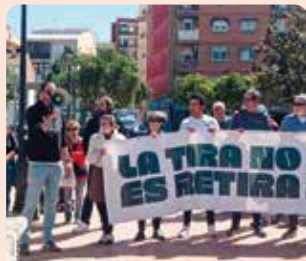
LA UNIÓ, en l'acte de suport a les Tires de Contar dels mercats municipals de València.