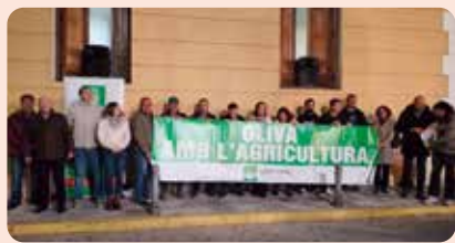
Representants de LA UNIÓ en un acte de protesta contra Mercosur a Oliva (La Safor).