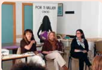
Participación de representantes de LA UNIÓ en la charla informativa celebrada en la Torre (València) sobre la recuperación de las huertas urbanas tras la dana.