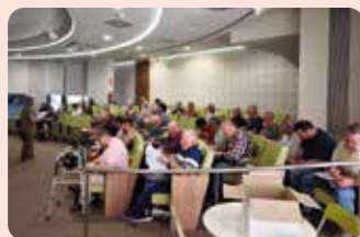
Curs de manipulador de plaguicides a Llutxent (Vall d'Albaida).