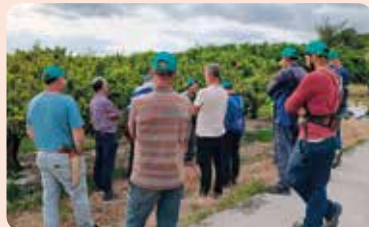
Curs de poda de cítrics a Quatretonda (Vall d'Albaida). Curs teòric i pràctica en camp.