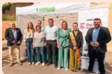
Participació de LA UNIÓ en la Fira de la Vall d'Alba (Plana Alta).