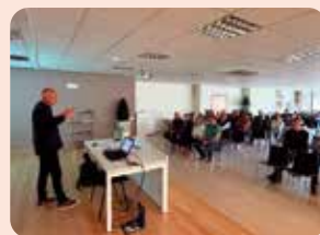
Xarrada informativa de LA UNIÓ a la Vall d'Alba (Plana Alta) sobre l'elaboració de l'oli de qualitat en camp i almàssera.