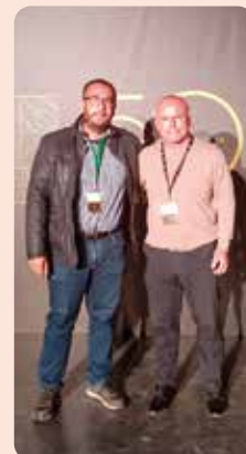
LA UNIÓ, en l'acte del 50 aniversari d'Anecoop.