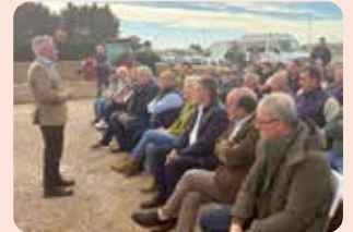
Representants de LA UNIÓ van participar en l'acte oficial de presentació de les ajudes a l'Horta celebrat a Meliana.