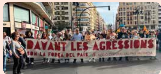
Participació de LA UNIÓ en la manifestació del 25 d'abril.