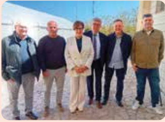
LA UNIÓ, present en la 33 edició de la fira agrícola de Rossell (Maestrat).