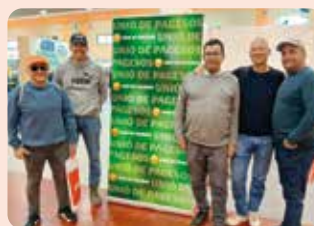
Representants de LA UNIÓ van estar a la Fira de Mollerusa (Lleida).