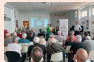
Representants de LA UNIÓ al Congrés d'Iniciativa.