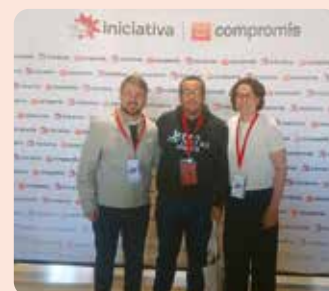
Representants de LA UNIÓ al Congrés d'Iniciativa.