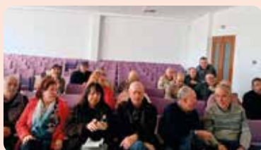
Reunión informativa para afectados de Crisol en Utiel.