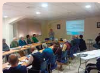
Curso de renovación de manipulador de plaguicides en Elx.