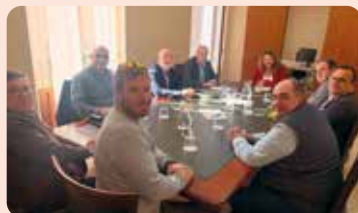
Reunió de les comunitats de regants d'Altea amb el director general de l'Aigua.