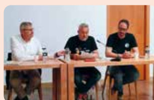
LA UNIÓ va participar en una taula rodona a Pego per a parlar de l'Acord de Mercosur i el futur de l'agricultura de la Marina Alta.