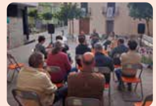
LA UNIÓ participa en una xarrada informativa sobre actualitat agrària a la Vall d'Uixó (Plana Baixa).