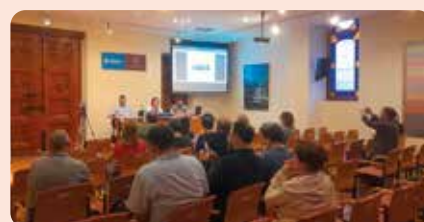
Participació de LA UNIÓ en la xarrada sobre plantes fotovoltaïques a la Vall d'Uixó (Plana Baixa).