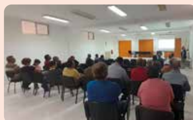
Jornada sobre la malaltia hemorràgica epizoòtica (EHE) a Morella (Els Ports).