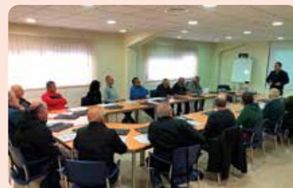
Curs de manipulador de plaguicides a Elx.