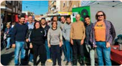
LA UNIÓ va participar un any més a la Fira de Cabanes (Plana Alta) on també va col·laborar en una jornada sobre agricultura regenerativa.