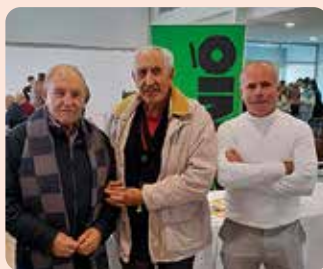
Feria de la Trufa Negra de El Toro (Alto Palancia) donde impartimos una charla sobre ayudas agrarias.