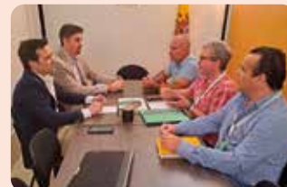
LA UNIÓ s'ha reunit fins a en dues ocasions en les darreres setmanes amb els quatre grups parlamentaris amb representació a les Corts Valencianes. Hem traslladat les nostres propostes de futur per al camp valencià i les nostres esmenes als pressupostos per a 2024.