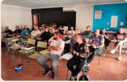
Curs de manipulador de plaguicides a Rafelguaraf (Ribera Alta).