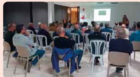
Xarrada informativa sobre maneig de la fertilitat i nutrició del sòl a Daimús (La Safor).