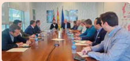
Reunió amb la IGP Torró de Xixona i Alacant i la Conselleria d'Agricultura.