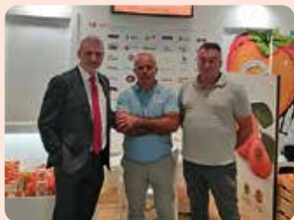
LA UNIÓ a Fruit Attraction.