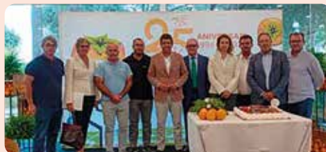
LA UNIÓ va participar a Carlet (Ribera Alta) en la presentació de la nova campanya del caqui.