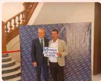
LA UNIÓ va participar en els actes de commemoració del 45 aniversari d'AVACU.