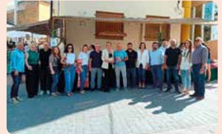
Un any més LA UNIÓ a la Fira de l'Ametlla d'Albocàsser (Alt Maestrat).