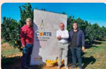
Acte del I Tall de la Taronja Valenciana organitzat per la IGP Cítrics Valencians a Rafelguaraf (Ribera Alta).