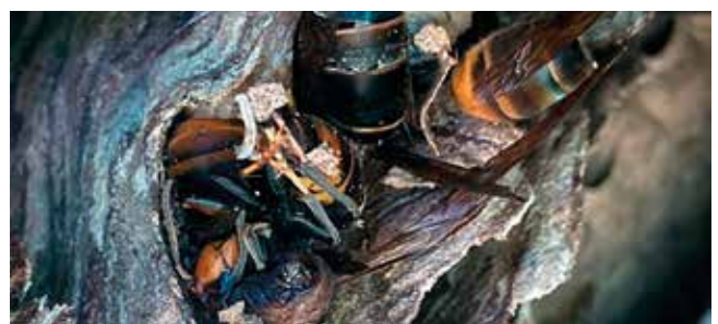
Detalle de la Vespa velutina .