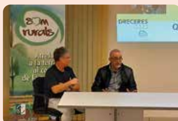
LA UNIÓ va participar a una xarrada de Som Rurals a Quatretonda (Vall d'Albaida).