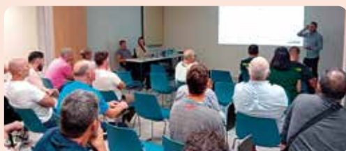
Xarrada informativa de LA UNIÓ a Callosa d'en Sarrià (Marina Baixa) per a informar sobre temes d'actualitat agrària (seguretat àmbit rural, ajudes PAC, primera instal·lació i plans millora i assegurances agràries).