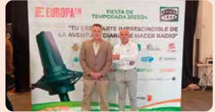
Festa de temporada 2023/2024 Onda Cerro Castelló.