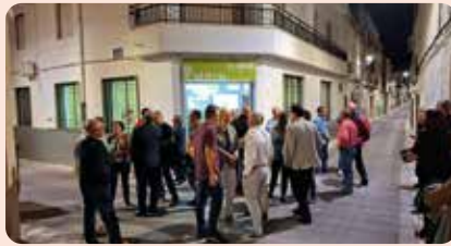
XXVIII edició de la Festa de LA UNIÓ a Quatretonda (Vall d'Albaida).