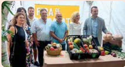
LA UNIÓ, a la Fira de la Tomata de Meliana (Horta Nord).