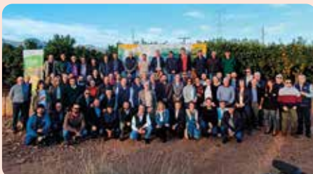
I Tall de la Nuleta de la Plana a la Vall d'Uixó (La Plana Baixa).