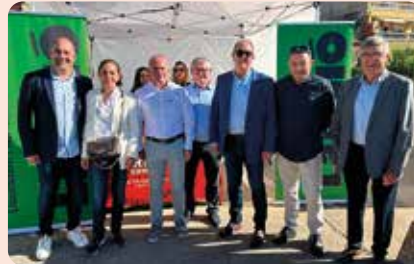
LA UNIÓ present un any més a la Fira de la Jana (Baix Maestrat).