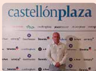
V Aniversari Castellón Plaza.