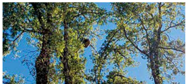
Situación del nido en el árbol.