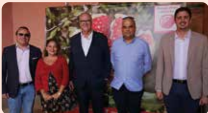
Acto del primer corte de la Granada Mollar de Elche.