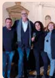
Una representació de LA UNIÓ estuvo presente en las Jornadas Vitivinícolas de la DO Utiel-Requena.