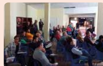
Xarrada de LA UNIÓ sobre seguretat en l'àmbit rural a Millena (El Comtat).