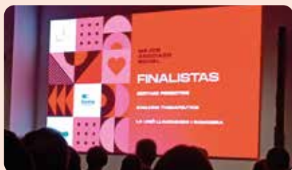
LA UNIÓ va participar en la Nit de Biotec y lliurament de premis de Bioval, on va ser entitat finalista com a millor associat de Bioval. També va presentar a Bioval quatre projectes de l'organització.