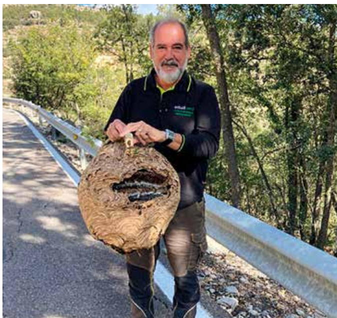
Primer nido retirado.

LA UNIÓN aconseja a los apicultores con asentamientos en las zonas donde está confirmada la presencia de la Vespa velutina que presten atención y ante cualquier sospecha de la presencia de la plaga den aviso a la Oficina Comarcal de Agricultura más próxima, intentando aportar fotografía para certificar que se trata de la Velutina. Se puede ver una presentación para la diferenciación de la Vespa Velutina de otras especies en: https://cutt.ly/uwzuXQrl