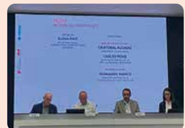
Intervenció de LA UNIÓ en la jornada Territori Agroalimentari.