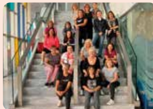
LA UNIÓ va celebrar enguany la seua Jornada de dones a Peníscola (Baix Maestrat), centrada en la gestió de l'empresa agrària.