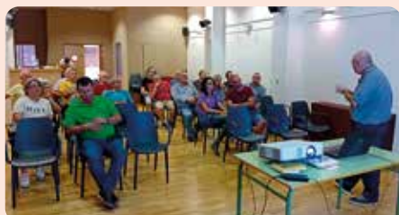
Xarrada informativa sobre el cultiu de la garrofa i la Xylella fastidiosa a Parcent (Marina Alta).