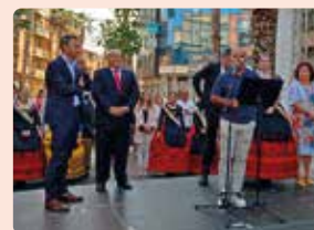
Inauguració XVIII de la Fira d'Agricultura i Comerç de Turís