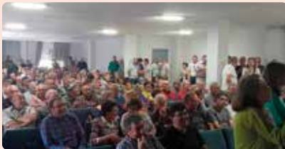
Xarrada Vall d'Alba contra projectes fotovoltaics