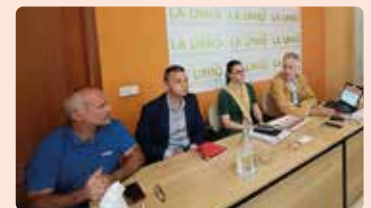
Presentació del Pla Integral Citrícola a la comissió citrícola de la Unió