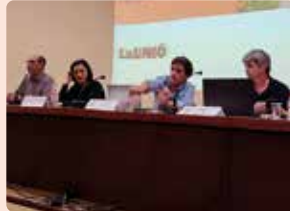
Xarrada informativa sobre estructura varietal cítrica a Algemés