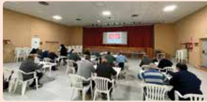
Curs de renovació del carnet de manipulador de plaguicides a Alcalà de Xivert