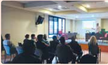
Charla informativa sobre planes de mejora en Utiel