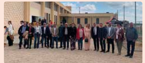
XXXª edició de la Fira de Sant Josep de Rossell