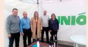
Fira del Comerç, Agrícola i de Ramaderia de Vall d'Alba