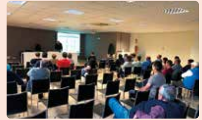
Xarrada sobre el cultiu de la garrofa a Vall d'Alba