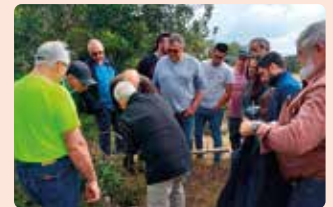
Jornada pràctica en camp empelt de garrofera a Càlig