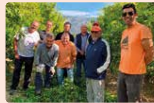
Jornada pràctica de poda de cítrics a Otos