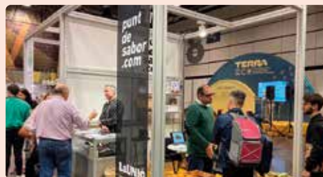
Participació en la fira TerraEco