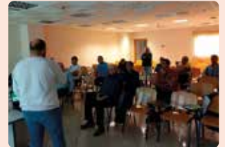
Xarrada sobre el pla estratègic de la PAC a Quatretonda