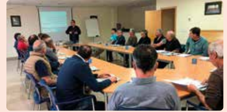
Curs de renovació de manipulador de plaguicides a Elx