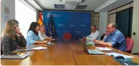
Reunió con el MAPA sobre la vendimia en verde