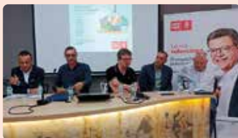
Jornada sobre agricultura y agua del PSPV en Orihuela