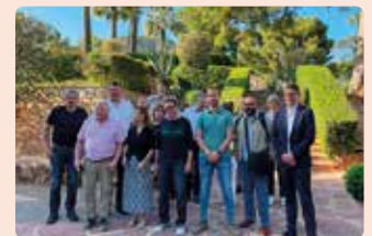
Reunió de la Unió amb ramaders i tècnics alemanys a Puçol