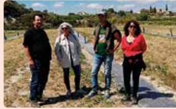
Visita camps de garroferes a l'Estació Experimental Agrària de Lutxent