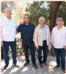
Festa l'Encissam del Diumenge de Rams a Alberic