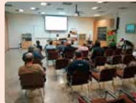
Xarrada sobre el cultiu de l'alvocat a Bétera