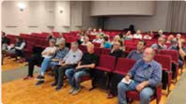
Xarrada informativa sobre el quadern digital de camp a la Pobla Llarga