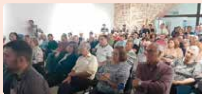
Xarrada Vilafamés contra projectes fotovoltaics