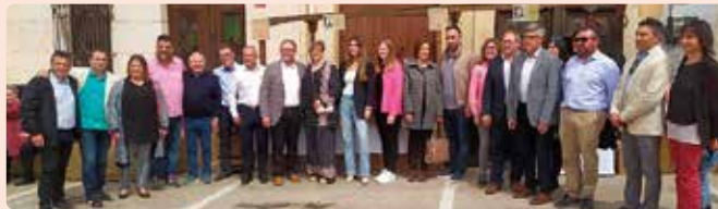
Fira de Sant Vicent i Dolços Tradicionals de Càlig