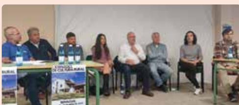
Representants de la Unió participen en les I Jornades de Cultura Rural a Benassal