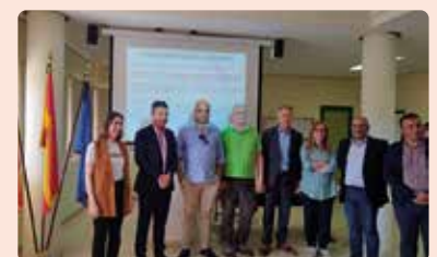
Presentació projecte rehabilitació de l'Estació Experimental Agrària a Elx