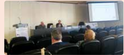
Xarrada sobre el cultiu de la garrofa a Elx (Baix Vinalopó).