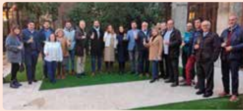
Acto en defensa del Cava de Requena.