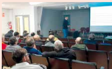
Xarrada sobre la nova PAC a Vall d'Alba (Plana Alta).