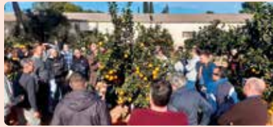
Visita noves varietats de cítrics per La Plana.