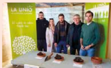
Mostra Tòfona Negra de l'Alt Maestrat a Catí.