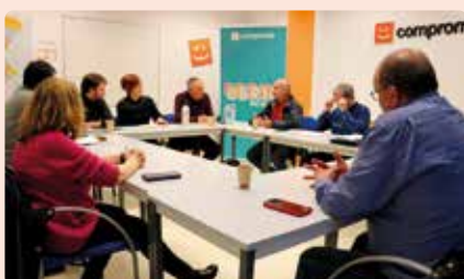
Reunió comissió executiva de LA UNIÓ amb Compromís.