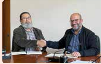
Signatura conveni col·laboració amb Ajuntament d'Elx.