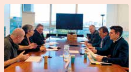
Reunió amb Conselleria Agricultura per a valorar accions a l'Horta.