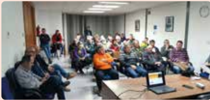
Xarrada informativa sobre el cultiu de la garrofa a Llutxent (Vall d'Albaida).