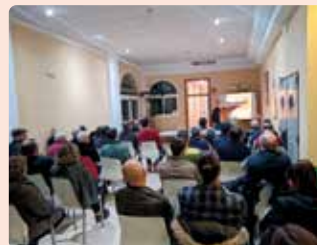
Xarrada sobre el cultiu de la garrofa a Altea (Marina Baixa).