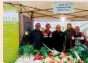
Ecofira de Montesa (La Costera).