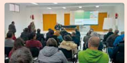
Xarrada sobre la nova PAC a Morella (Els Ports).