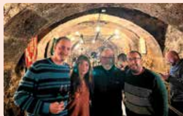
Joves de LA UNIÓ a la trobada celebrada a Aranda de Duero (Burgos).