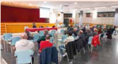
Xarrada quadern digital d'explotació a la Pobla de Vallbona (Camp de Túria).