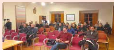
Xarrada sobre el cultiu de la garrofa a la Vall d'Uixó (Plana Baixa).