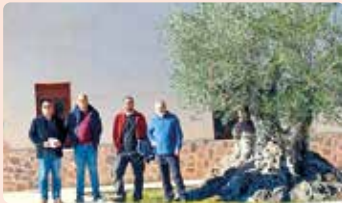
Visita a l'Almàssera de Millena (El Comtat).