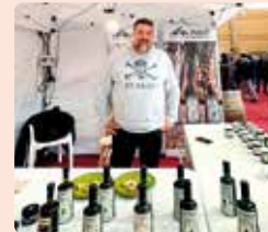
L'empresa associada a LA UNIÓ, Pobill Ecològics de Càlig (Baix Maestrat), a la Fira de Benicarló.