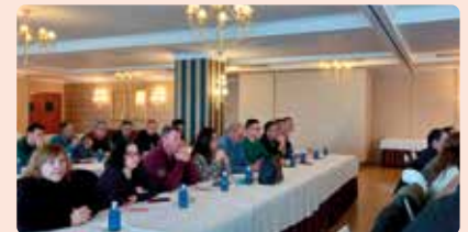
Jornades del Vino en Medina del Campo (Valladolid).