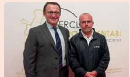
Lliurament dels Premis del Cercle Agroatimentari de la Comunitat Valenciana.