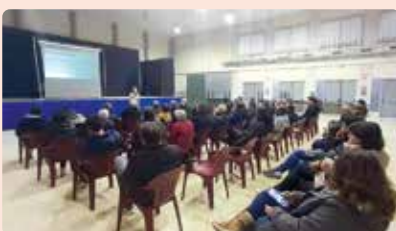
Xarrada sobre nou sistema cotització autònoms a la Jana (Maestrat).