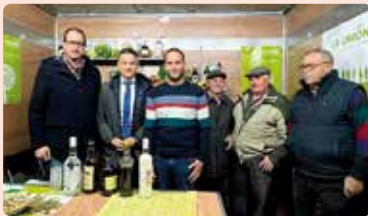
Fira de Sant Sebastià a Silla (Horta Sud).