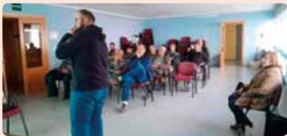
Charla informativa de la nueva PAC en Titaguas (Los Serranos).