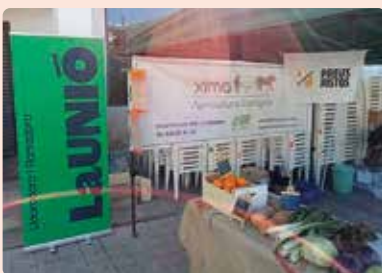
Mercat Agroecològic de Guadassuar (Ribera Alta).