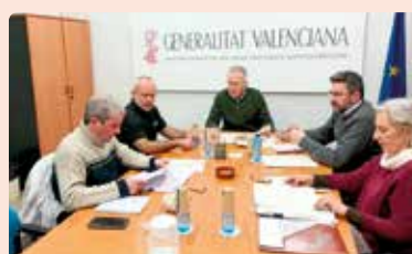
Reunió amb Conselleria Agricultura per a conèixer funcionament AVICA.