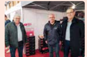
Fira de Sant Antoni a Benicarló (Maestrat).