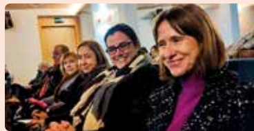
Foro de Economía Comarcal organizado por Levante-EMV en Utiel.