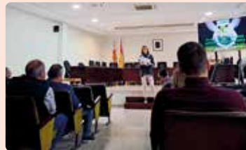
Xarrada noves cotitzacions autònoms a Meliana (Horta Nord).