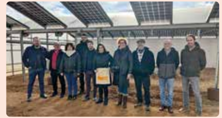
Taller projecte Agrovoltaica a Picassent (Horta Sud).