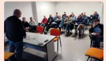
Xarrada sobre el cultiu de la garrofa a Carlet (Ribera Alta).