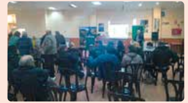
Charla sobre ayudas post-incendio en Bejis (Alto Palancia).