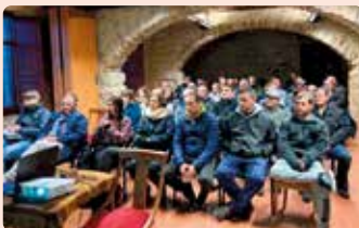
Xarrada sobre la nova PAC a Albocàsser (Alt Maestrat).