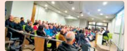
Xarrada quadern digital explotació a Betxí (Plana Baixa).