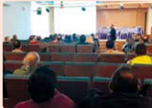
Charla informativa sobre la nueva PAC en Utiel.