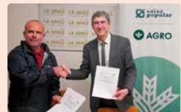
Signatura de renovació conveni de col·laboració amb Caixa Popular.