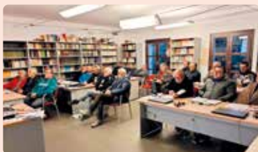
Jornades associacionisme i OPFH Montesa (La Costera).