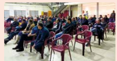
Xarrada sobre la nova PAC a la Jana (Maestrat).