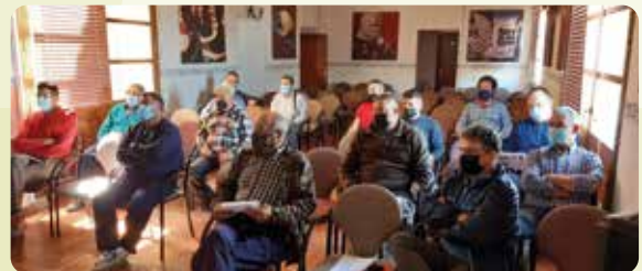
Xarrada informativa sobre la nova PAC a Otos (Vall d'Albaida).