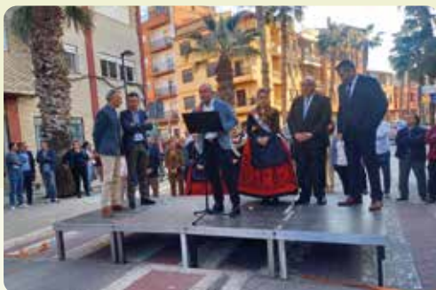
Inauguració Fira Agrícola de Turís (Ribera Alta).