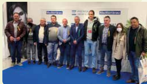
LA UNIÓ va fer una visita als diferents mitjans de comunicació a les festes de la Magdalena de Castelló.