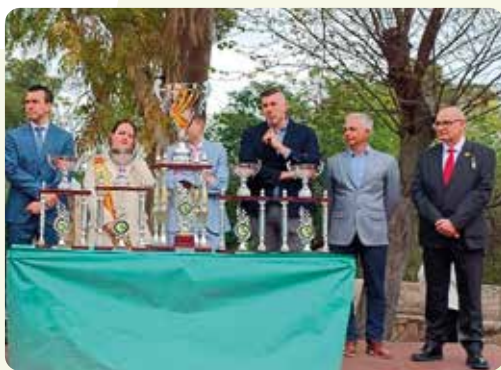
El diumenge de Rams representants de LA UNIÓ van participar al Concurs de l'Encisam d'Alberic i el lliurament de trofeus.