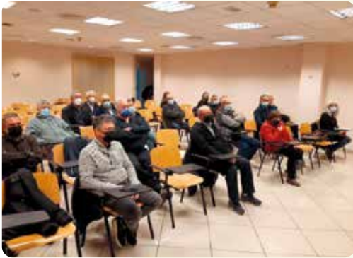
Assemblea Local de LA UNIÓ a Quatretonda (Vall d'Alba).