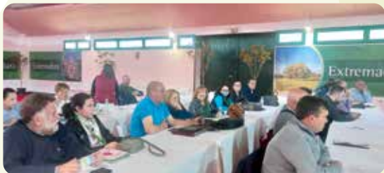
Una representació de LA UNIÓ participó en Almendralejo (Extremadura) en las jornadas estatales de la Unión de Uniones Agricultores y Ganaderos sobre políticas públicas en el sector vitivinícola.