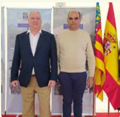
Una representació de LA UNIÓ de Llauradors participó en la presentació del proyecto de mejora de la red de infraestructuras hidráulicas para el riego de la Vega Baja que se celebró en Dolores.