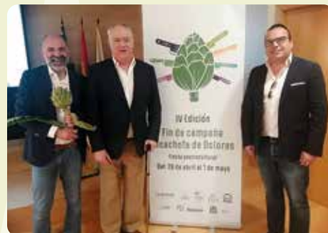
IV edició fin de campanya de la Alcachofa de Dolores (Vega Baja).