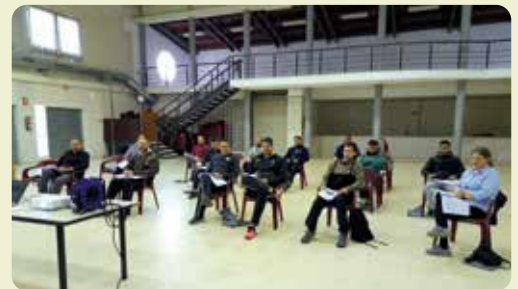
Curs de manipulador de plaguicides a La Jana (Maestrat).