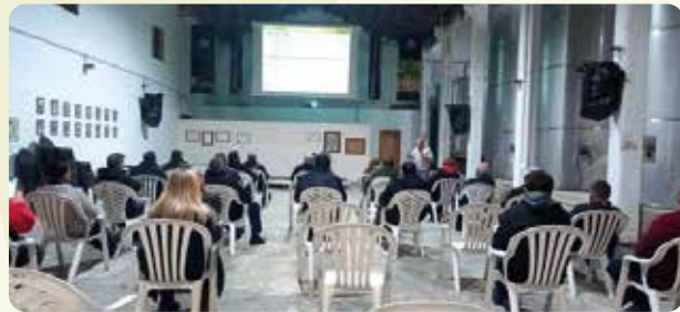
Charla informativa sobre la nueva PAC en Godelleta (Hoya de Buñol).