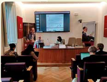
Una representació de LA UNIÓ participó en Roma en la reunió de inicio del proyecto europeo Erasmus + Circular Bricks.