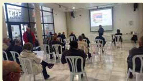
Xarrada informativa de LA UNIÓ a Beniarjó (La Safor) per a parlar de la nova PAC i com ens afectarà i també sobre com elaborar un pla de fertilització en cítrics.