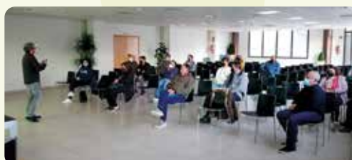
Xarrada sobre la nova PAC a Vall d'Alba (Plana Alta).