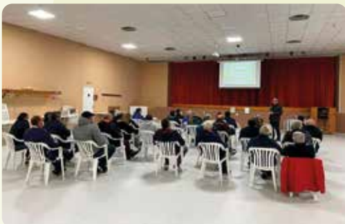
Curs higiene en la producció primària a Alcalá de Xivert (Baix Maestrat).