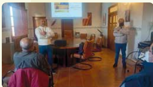
Curs sobre la poda de cítrics a Otos (Vall d'Albaida), tant teòric informatiu com amb pràctiques en camp.